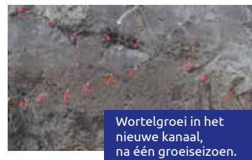
Wortelgroei in het nieuwe kanaal, na één groeiseizoen.