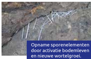
Opname sporenelementen door activatie bodemleven en nieuwe wortelgroei.

> kijk op tfi.nl voor meer reacties uit de praktijk