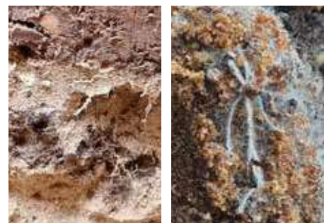
Links: Wortelgroei in nieuwe scheuren en poriën gevuld met substraat Rechts: Bodemleven/mycorrhiza schimmels na TFI-behandeling

Het resultaat is duurzaam behoud van vitale bomen met een gezond bladerdek: dé basis voor een groene en vitale leefomgeving.