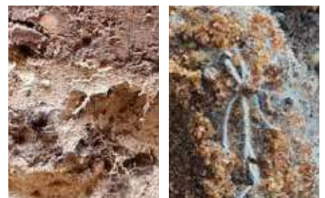
Links: Wortelgroei in nieuwe scheuren en poriën gevuld met substraat Rechts: Bodemleven/mycorrhiza schimmels na TFI-behandeling

verbeteren en diepere wortelgroei te stimuleren leven bomen op, staan ze stabiel en zijn ze beter bestand tegen ziekten en plagen. Ook nieuwe aanplant krijgt, zonder graafwerkzaamheden en overlast, een vliegende start met een langdurig verrijkt bodemleven en diepere en beter vertakte wortelgroei.