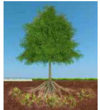
4 RESULTAAT: OPTIMALE WORTELGROEI EN REGENWATERINFILTRATIE

"Sinds de behandeling hebben wij geen wateroverlast meer op het speelveld, wij zijn dan ook zeer tevreden."