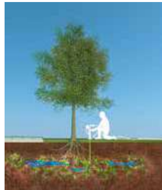
3 DE RUIMTE VULLEN MET ONS NATUURLIJKE TFI-SUBSTRAAT