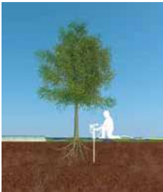
1 ZORGVULDIG EEN LANS IN DE BODEM BRENGEN