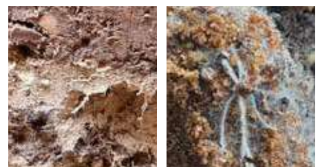
Links: Wortelgroei in nieuwe scheuren en poriën gevuld met substraat Rechts: Bodemleven/mycorrhiza schimmels na TFI-behandeling

natuurlijke weerstand van de boom. Het resultaat: vitale bomen met een toenemend kroonvolume en een gezond bladerdek, die langdurig minder overlast opleveren en duurzaam bijdragen aan een vitale, groene leefomgeving. We garanderen dat er minimaal drie jaar lang 80% minder luisoverlast optreedt!